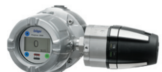
Dräger Polytron 8720 с присоединенной распределительной коробкой e-Box: версия с проводкой повышенной безопасности.