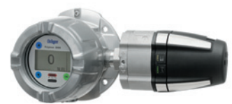
Dräger Polytron 8720 Взрывозащищенная измерительная головка для контроля концентрации диоксида углерода.